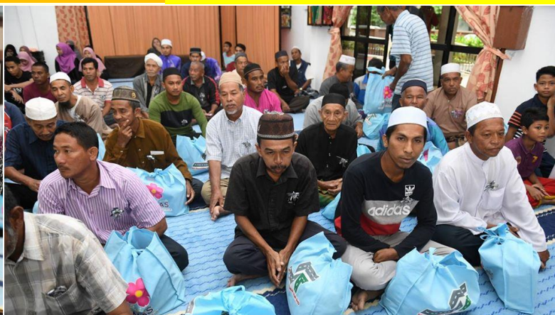
Sebahagian keluarga angkat yang turut bersama dalam majlis perasmian