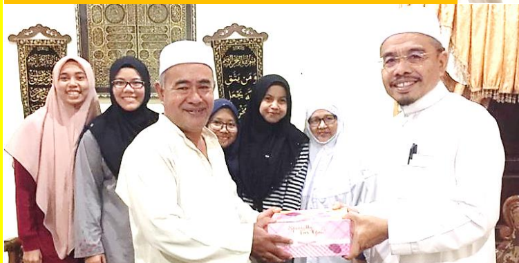
Sesi ziarah mahabbah ke kediaman keluarga angkat