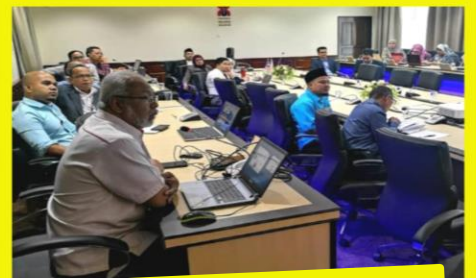
SESI PERKONGSIAN WAKAF UNIVERSITI AWAM BERSAMA PENGARAH WAZAN UPM 18/8/2019