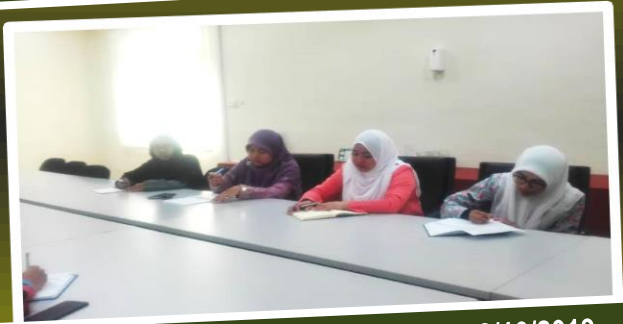
MESYUARAT JAWATANKUASA HAL EHWAL WANITA (HELWA) PUSAT ISLAM UMK 8/10/2019