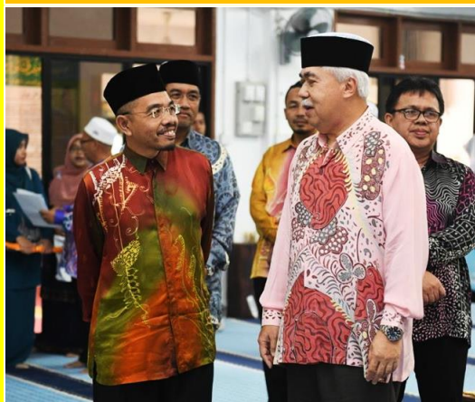
Tengku Temenggong Kelantan bersama Pengarah PIUMK seusai majlis perasmian