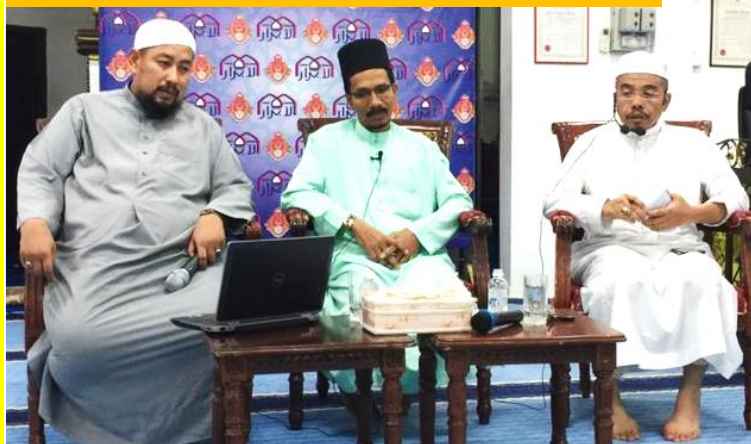
Forum Hal Ehwal Islam yang diadakan pada sebelah malam