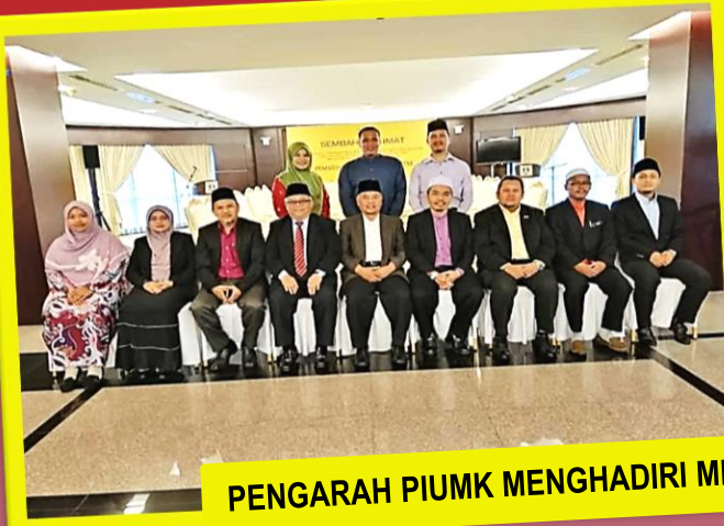
PENGARAH PIUMK MENGHADIRI MESYUARAT JAHEIS KALI KE-2 21/7/2019