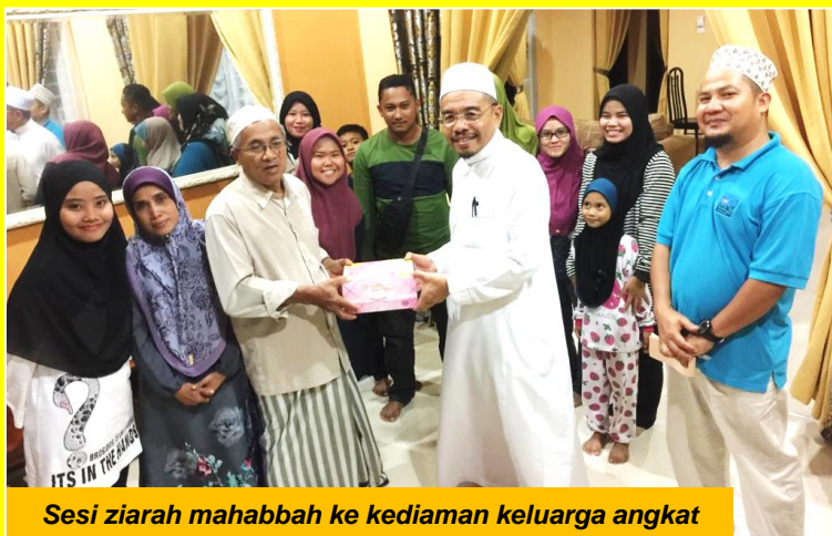
Sesi ziarah mahabbah ke kediaman keluarga angkat