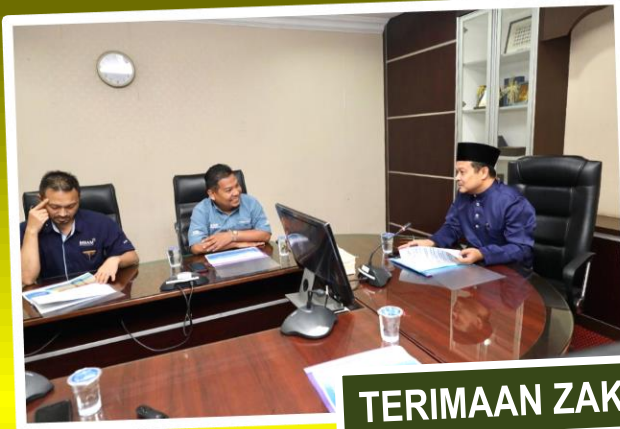
TERIMAAN ZAKAT PNB 25/11/2019