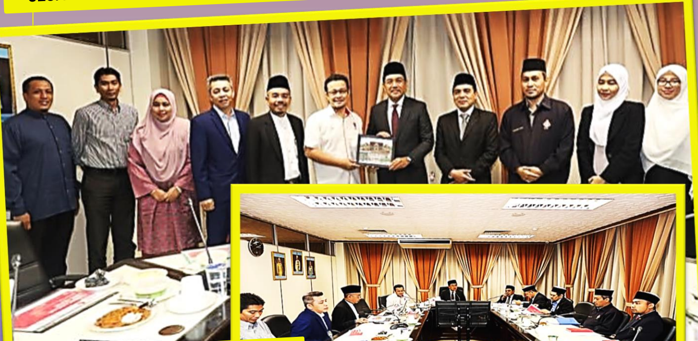
KUNJUNGAN HORMAT PUSAT ISLAM UMK BERSAMA NC UMK KE MAIK 8/12/2019