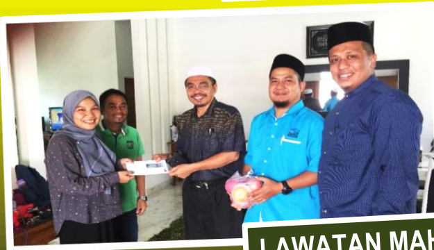
LAWATAN MAHABBAH STAF SAKIT