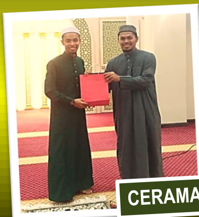
CERAMAH MAULIDUR RASUL 25/11/2019